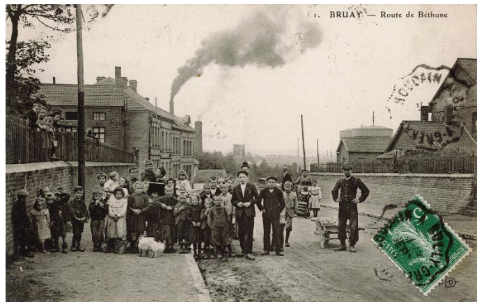
Libre de droits